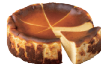
미루꾸 바스크 치즈케이크 (조각/홀케이크)

미루꾸 베이커리 공장은 카페에 맞는 최신 트렌드의 다양한 제과/제빵 제품을 직접 제작하고 납품합니다.