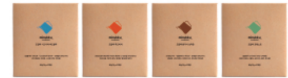
미루꾸 드립백 4종