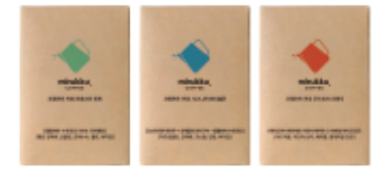
미루꾸 크래프트 커피 3종