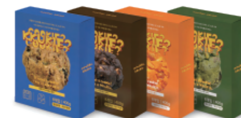
미루꾸키 생지 4종 (오리지널/초코 헤이즐넛/황치즈 마카다미아/말차 마카다미아)