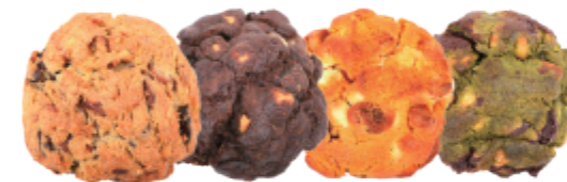
미루꾸키 4종 (오리지널/초코 헤이즐넛/황치즈 마카다미아/말차 마카다미아)