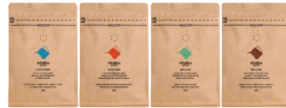
미루꾸 원두 200g/500g/1kg

언제 어디서나 간편하게 고품질의 원두를 즐길 수 있도록 다양한 제품들은 제작하여 제공하고 있습니다.