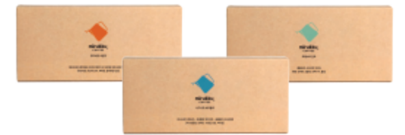
미루꾸 캡슐커피 3종