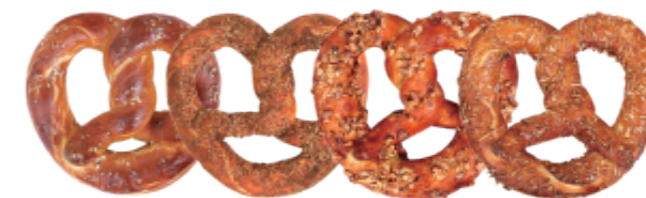
미루꾸 프레즐 5종 (소금버터/아몬드크림/펄시나몬/스윗코코넛/베이컨쪽파크림치즈)